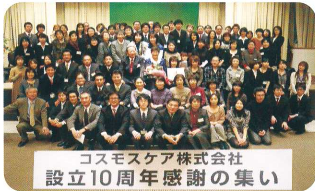
コスモスケア株式会社 設立10周年感謝の集い